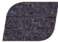
JASPE CARBÓN C5106