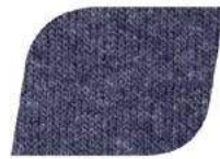
JASPE MARINO F5222