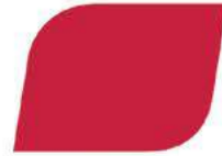
ROJO 05508 / 05510