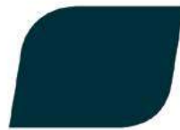
MARINO 05264 / 05232